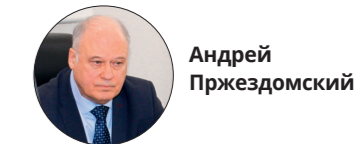
руководитель информационного центра Национального антитеррористического комитета

Происходящие акты скулшутинга не случайны. Все нападающие отдают отчёт своим действиям