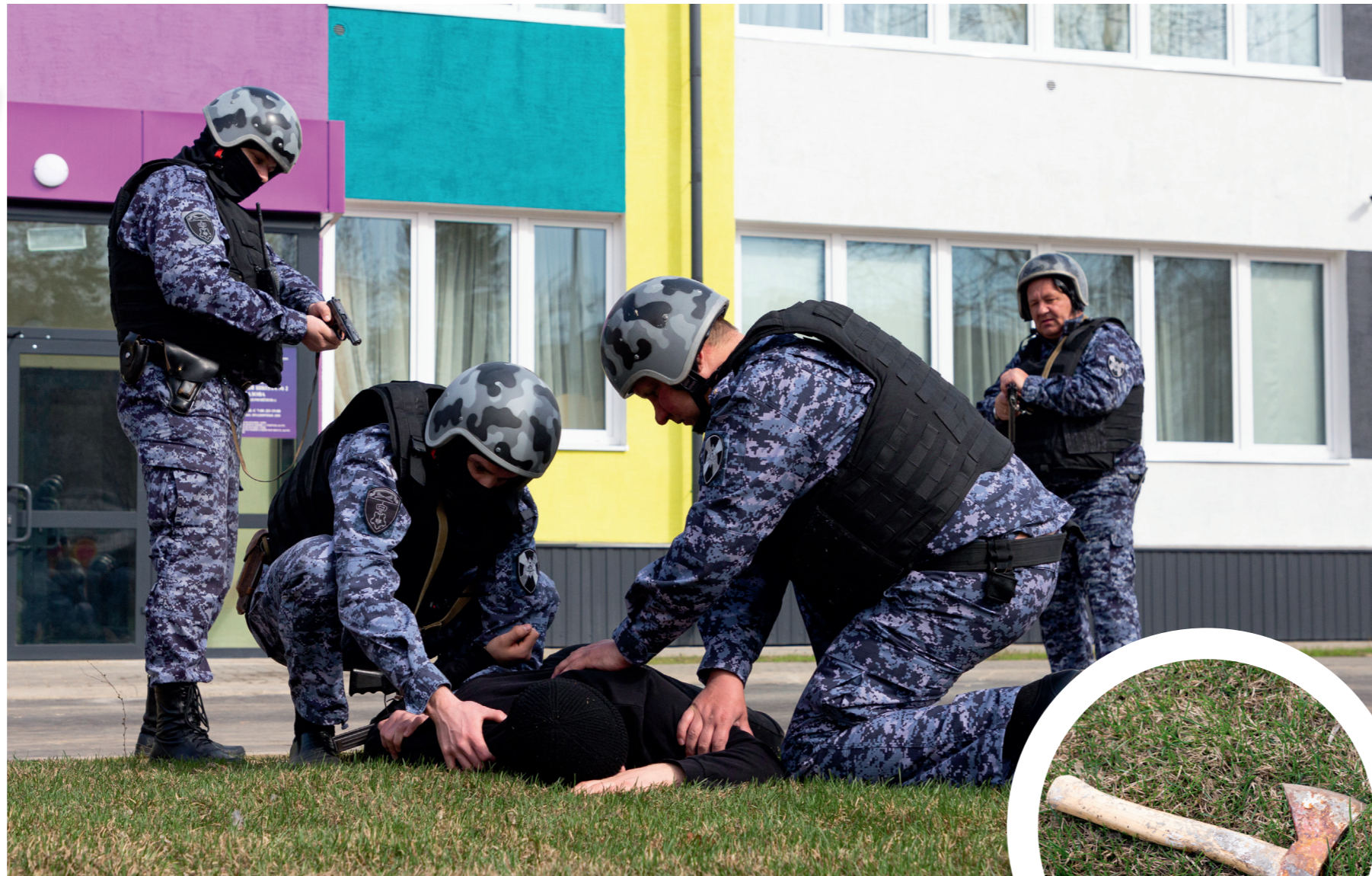
Вооружившись топором, юноша пытался войти в помещение, снимая происходящее на экшен-камеру

— Подобные тренировки максимально приближены к реальному сценарию, и неважно,