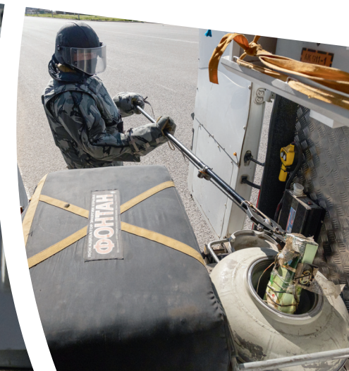
☑ Выполнив предварительные мероприятия по обезвреживанию, сапёр при помощи манипулятора помещает бомбу в специальный контейнер для перевозки опасных предметов