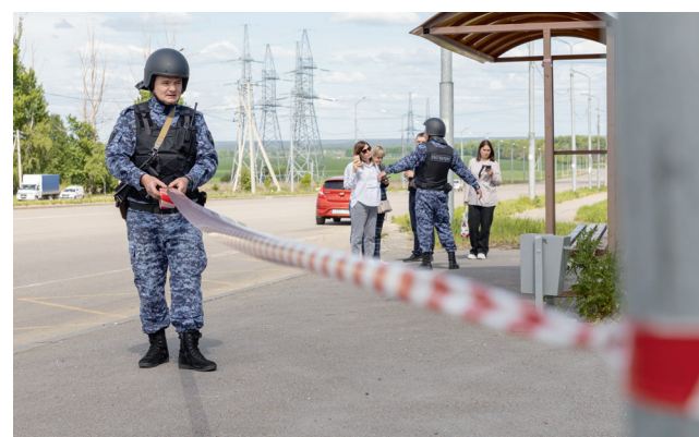
☑ Сотрудники вневедомственной охраны оцепляют опасный участок и эвакуируют местных жителей

здания, в котором есть люди, поэтому на месте его уничтожить нельзя.