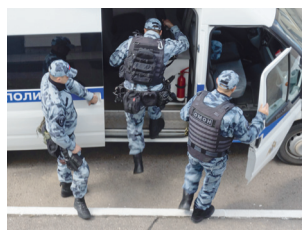
☑ После поступления сигнала от оперативного дежурного омоновцы в считанные минуты выезжают по указанному адресу

вышел из машины. Вокруг остановки общественного транспорта собралась толпа зевак.