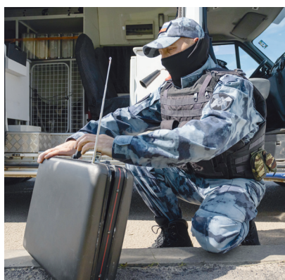
☑ Блокатор радиуправляемых взрывных устройств имеет широкий диапазон подавляемых частот. Он глушит рации и мобильные телефоны злоумышленников, и те уже не могут дистанционно подать сигнал на подрыв

С поступлением сообщения у инженерно-технического подразделения ОМОНа «Вал» есть считанные минуты на сбор. Чем быстрее они приедут на место и проведут работы по обезвреживанию,