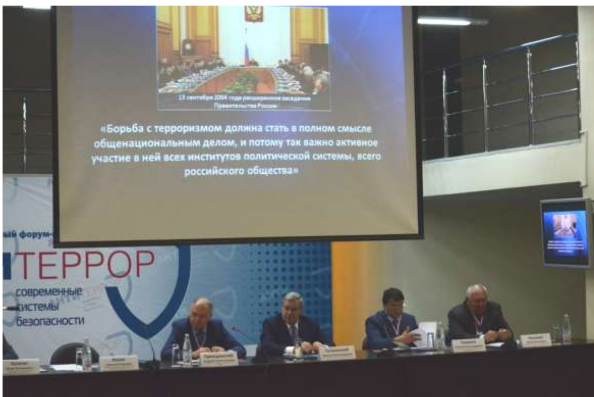
Открытие научно-практической конференции