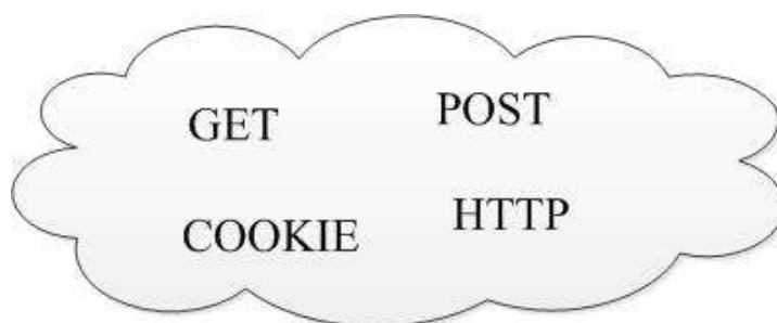
Рисунок. Множество данных

Другим большим недостатком является маленькое покрытие пользовательских данных. Правилom безопасных web-приложений считается не доверять никаким данным, которые может модифицировать пользователь. Эти данные можно представить в виде множества «А», которое состоит из четырех составляющих: GET, POST параметров, данных COOKIE и HTTP заголовков (рис.).