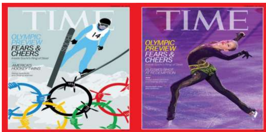
Рисунок. Обложка журнала «Time» вышедшего в феврале 2014 года в США (слева) и в Европе (справа)

На примере Олимпиады 2014 г. в Сочи видно, как многие блогеры, иностранные и российские СМИ в самом начале олимпиады активно уверяли пользователей, что в Сочи все очень плохо организовано. Интернет пестрил выпусками типа «Ляпы олимпиады», а известный журнал «Time» в США вышел в феврале с обложкой, на которой изображен трамплингист, на лыже которого надпись «SOCHI», а внизу страницы – разноцветные олимпийские кольца, выполнение в виде колючей проволоки. На обложку вынесен заголовок статьи «Olympic Preview: Fears & Cheers» (перевод автора: «Предпросмотр олимпиады: Опасения и Удивление»). Причем этот же журнал вышел в Европе с обложкой, на которой размещена фотография российской фигуристки чемпионки Олимпиады 2014 г., чемпионки Европы 2014 г. Юлии Липницкой. Такое распределение тематики говорит о направленности пропаганды. Для одних Россия – ГУЛАГ, для других – страна чемпионов.