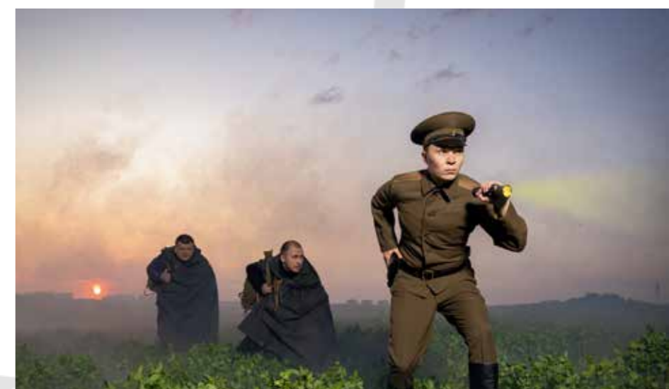
СЕНТЯБРЬ // 2023

В ЭТОМ году коллектив Управления ФСБ России по войскам национальной гвардии отмечает 40 лет со дня образования.