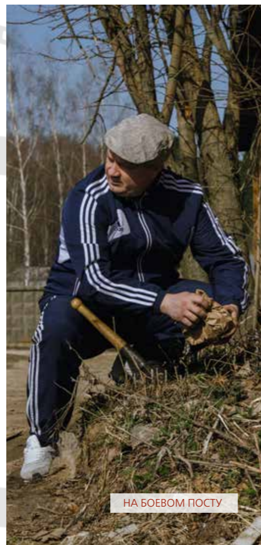
НА БОЕВОМ ПОСТУ

Незаконное проникновение на территорию – теперь реальность. Сами рабочие вспоминают, что ограда по периметру предприятий не выглядела непреодолимым препятствием, кое-где были даже дыры в заборе.