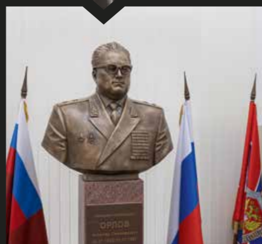
НА БОЕВОМ ПОСТУ