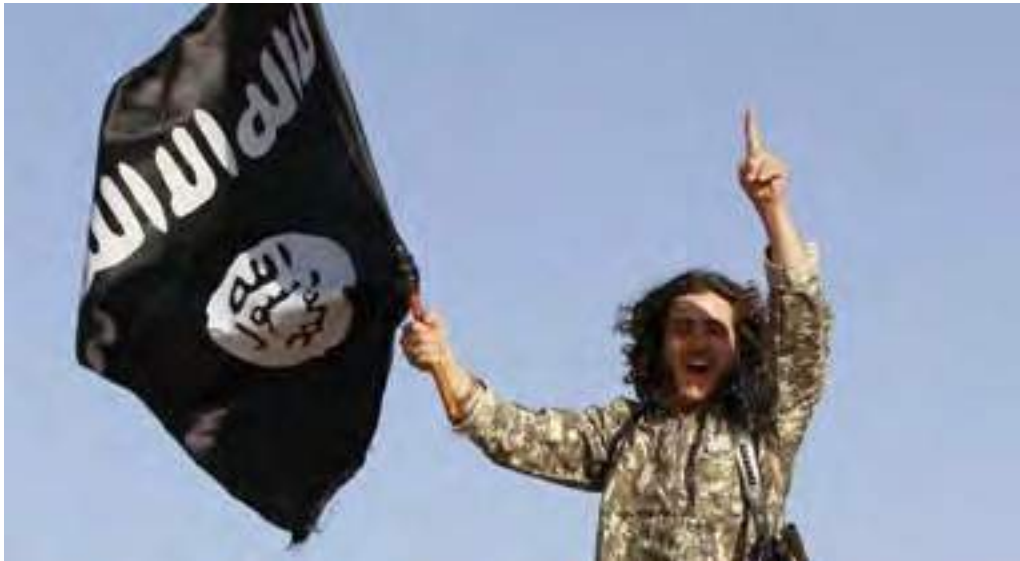
эксперты говорят о широком международном наступлении джихадистов под флагом так называемого «Исламского государства» (ИГИЛ)

Нельзя сбрасывать со счетов и усталость от конфликтов, в наибольшей степени проявившуюся в Чечне. Сегодня многие «знатоки» Кавказа (чьи познания о регионе не выходят за рамки трех-четырех понятий, таких как «тейп», «клан» и «терроризм») спекулируют на тему неких особых «кавказских традиций», упуская из виду, что в том же чеченском обществе, не знавшем феодализма, «традиционным уклоном» была не жестко выстроенная «вертикаль», а эголитарные порядки.