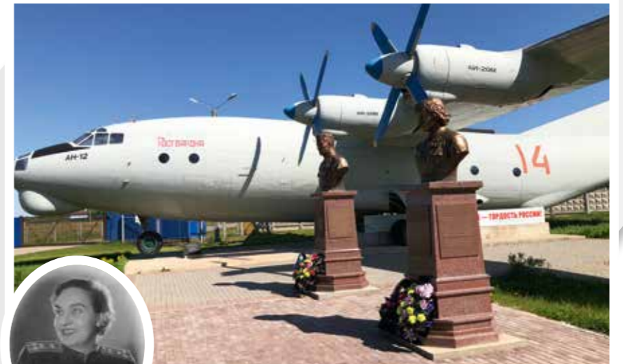
Мемориал в честь Героев лётчиков у авиационной части Росгвардии. Герой Советского Союза, Герой Социалистического Труда В.С. Гризодубова

Профессия лётчика по сути своей во многом героическая. Не случайно первыми Героями Советского Союза стали семеро авиаторов, спасавших людей с затонувшего во льдах Северного Ледовитого океана парохода «Челюскин» в начале 1934 года. Кстати, и первыми женщинами, удостоенными высокого звания, стали тоже лётчицы: Валентина Гризодубова, Марина Раскова и Полина Осипенко из экипажа самолёта «Родина», совершившие беспосадочный перелёт Москва – Дальний Восток. Память о команде героического экипажа Валентине Гризодубовой хранят авиаторы Росгвардии. У въезда на территорию одной из наших авиационных частей сооружён замечательный мемориал: рядом с бюстами трижды Героев Александра Покрышкина и Ивана Кожедуба стоит скульптура в честь Валентины Степановны. Она работала на местном аэродроме, входившем прежде в структуру Лётно-исследовательского института им. М. Громова. К памятнику Героя Советского Союза и Героя Социалистического Труда полковника Гризодубовой росгвардейцы приносят цветы.