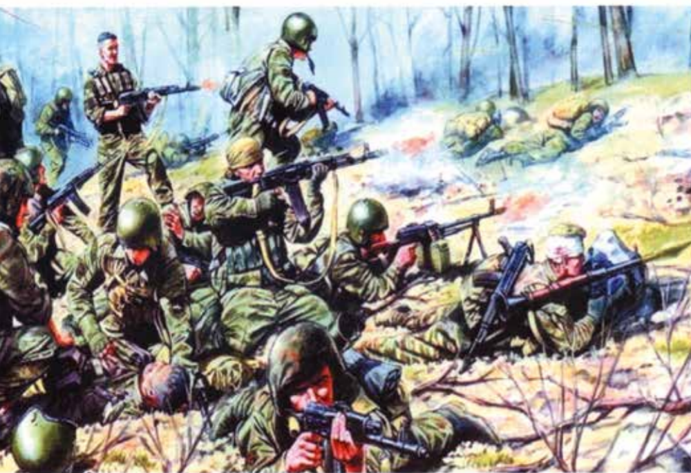
Бой на Лысой горе. 18 апреля 1995 года. Художник А. Карашук

Нашей редакцией издано несколько книг о Героях, назовём хотя бы «Звёзды мужества» и «Золотые Звёзды Росгвардии». Издания эти есть в библиотеках. Геройская тема всегда присутствует в журнале «На боевом посту» (как и в этом номере), в газете «Росгвардия сегодня».