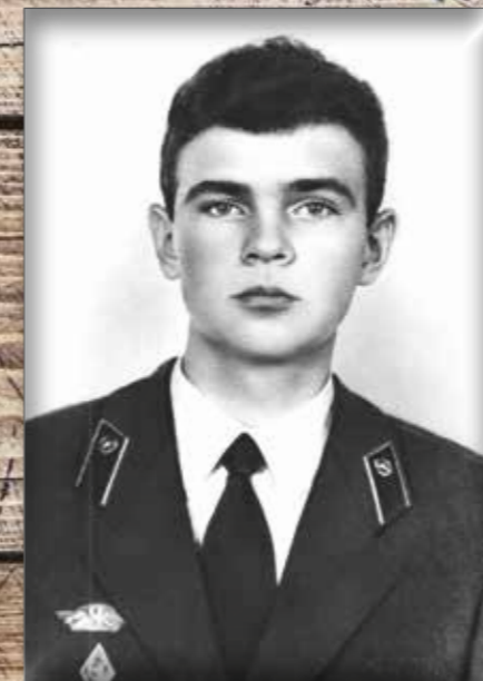
Герой Советского Союза лейтенант Олег Бабак: «Смотрю в загорелые лица друзей, в лица, что знакомы до боли. И так захотелось чего-то такого, понимаешь... Хотел бы для них, знаешь... Ну хоть так: «Мужики, уходите, я прикрою!» Слава богу, не надо так!» (Из письма знакомой девушке)